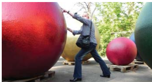
Es ist noch viel anzuschieben, packen wir's an ...

Was dabei herauskommt, wenn sich Visionäre und Macher zusammuntun: 30000 m 2 Fläche, ein Ort für Investitionen, Kunst, Kultur, Begegnungen al-