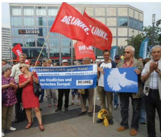
Am Freitag vor der Europawahl waren noch zahlreiche Marzahn-Hellersdorfer Linke bei der Veranstaltung auf dem Alexanderplatz in Berlin dabei, unterstützt von der Aktionsgruppe mit ihrem Transparent: Zusammenstehen gegen Nazis!

Das Warten auf das vorläufige amtliche Endergebnis der Europawahl am 25. Mai dauerte bis weit nach Mitternacht. Bereits erste Hochrechnungen machten deutlich: Angesichts einer um etliche Pro-