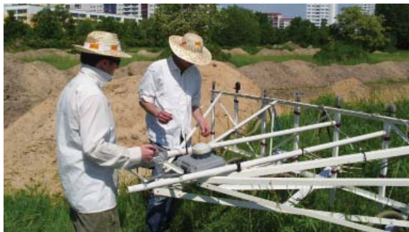
Archäologen bei digitaler-elektromagnetischer Boden-erkundung

Da die ca. 40 cm starke Mutterbodenschicht auf den ca. 12 ha ganzflächig abgetragen wird, müssen sich die Archäologen zwar beeilen,