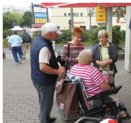
Noch am Vortag der Europawahl im Gespräch mit Bürgerinnen und Bürgern im Bezirk: Petra Pau (Bildmitte).

Die Beratung war öffentlich, prominente Rechtsexperten waren berufen: Hans-Jürgen Papier, Wolfgang Hoffman-Riem und Matthias Bäcker.