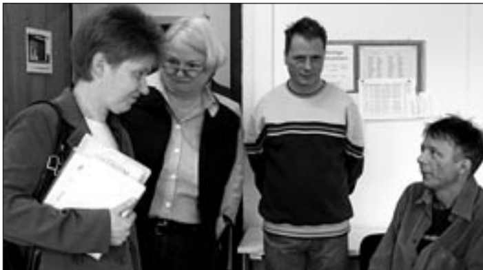
Petra Pau - wie so oft - unterwegs im Wahlkreis. Hier beim Besuch des Berlin-Brandenburger Bildungswerks, dessen Archiv sich im Bezirk Marzahn-Hellersdorf befindet.

In der zu Ende gehenden Wahlperiode ist Petra Pau auch als Vizepräsidentin des Deutschen Bundestages zu einer Politikerin geworden, um die uns andere Parteien wegen