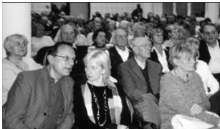
Blick in den vollen Münzenbergsaal am 2. 11. 2007.