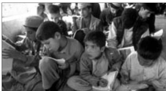
Eine von SAVE THE CHILDREN geförderte Grundschule für Jungen in Basthaun.